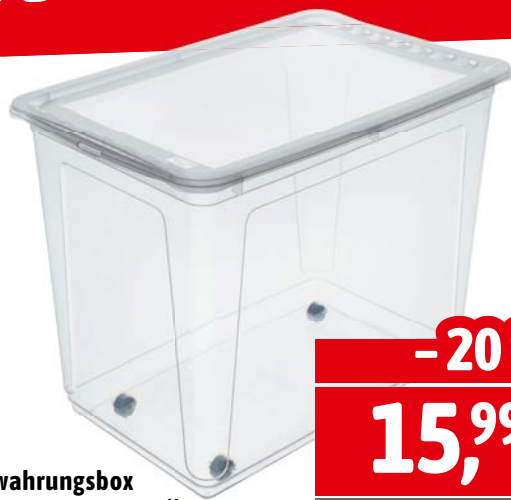
Aufbewahrungsbox „Bert“, transparenter Kunststoff mit Rollen, 63 l, staubsicher.